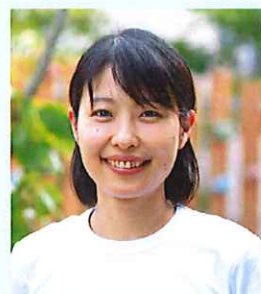
せんかわみんなの家 副主任