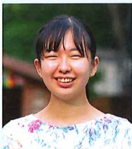
せんかわみんなの家 保育士

みんなの家のことを知ったのは、大学3年生の冬でした。学内で内定者報告会というイベントがあり、そこで、せんかわみんなの家に内定をもらった先輩がスピーカーとして話をしてくれました。みんなの家が大切にしている“子どもが愛されているという実感をもてる保育”“自慢したいくらい人間関係”について、熱く語ってくれていて素敵な人だなと思いました。ただ、私はもともと、ピアノや歌が好きだったので、なんとなく自分には幼稚園教諭が合っているのではないかと思っていたこともあり、就職活動では、幼稚園の情報を集めていました。でもなかなかピンとくる園がなくて…。